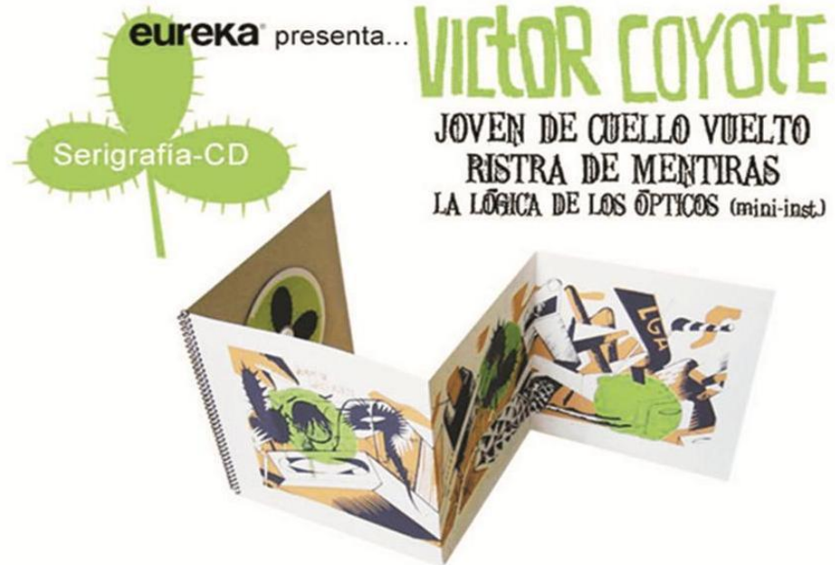
JOVEN DE CUELLO VUELTO Serigrafía-CD